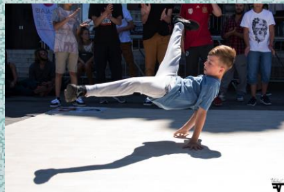
Jeunesse à Buenos Aires en 2018.